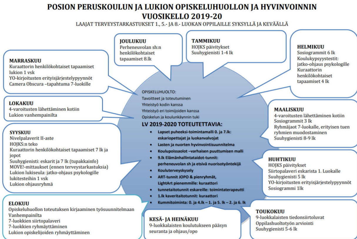
Kuvio 1. Posion peruskoulun ja lukion opiskeluhuollon ja hyvinvoinnin vuosikello 2019-2020

Posion peruskoululla ja lukiolla on yhteinen opiskeluhuollon ja hyvinvoinnin vuosikello, jota käytetään oppilas- ja opiskelijahuoltotyön pohjana. Keskeinen toimija oppilashuoltotyössä on säännöllisesti, noin kerran kuukaudessa, kokoontuva moniammatillinen opiskelijahuoltotyöryhmä, johon kuuluvat rehtori, apulaisrehtori, opinto-ohjaaja, erityisopettajat, koulunkäynninohjaaja, kuraattori, terveydenhoitaja, psykologi, oppilas- ja opiskelijakuntien edustajat sekä huoltajien edustaja.