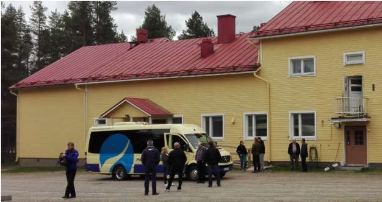
Kuloharjun kyläseuran (kuvagalleria)

Ikäihmisillä on mahdollisuus vaikuttaa kunnan toimintaan muun muassa osallistumalla järjestettyihin keskustelutilaisuuksiin, kuten esimerkiksi kuntalaiskahviloihin. Myös vanhusneuvostolla on tärkeä rooli ikäihmisten äänen esille tuomisessa.