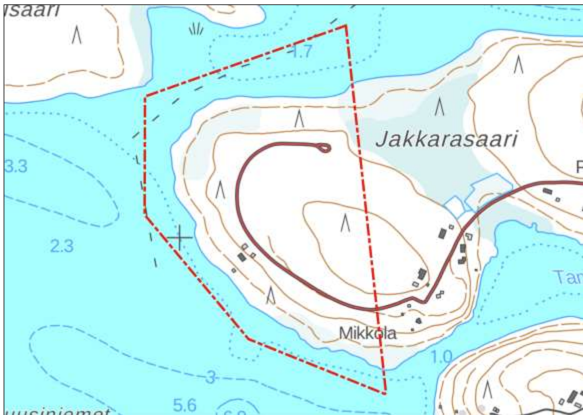
Kuva 1. Suunnittelualan sijainti. Kaava-alueen raja on esitetty punaisella katkoviivalla.

Asemakaava-alueen sijainti on esitetty kuvassa 1. Alue sijoittuu Jakkarasaaren alueelle, Posion keskustaajaman tuntumaan. Alue on noin 58 hehtaarin kokoinen.