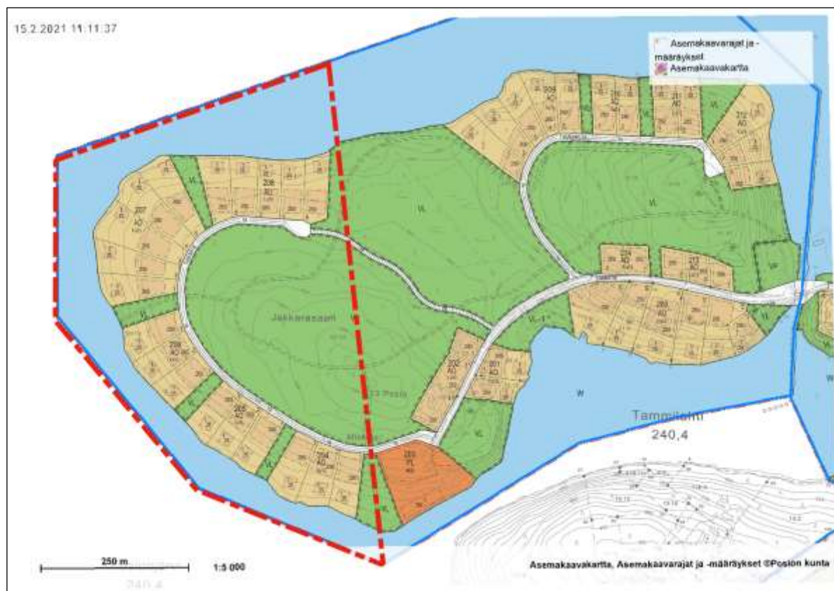
Kuva 4. Asemakaavoitus suunnittelualueella. Suunnittelualue on rajattu punaisella.