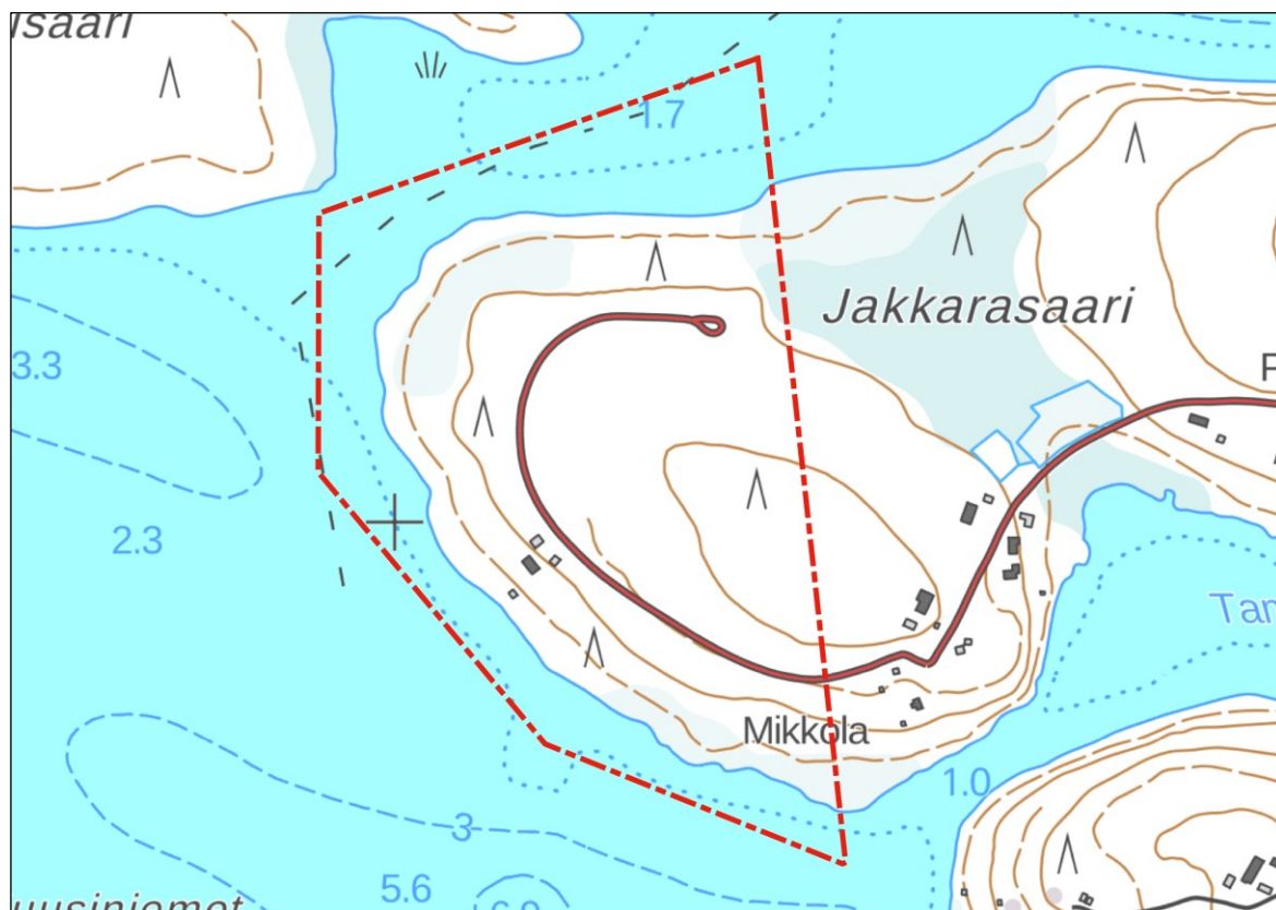
Kuva 1. Suunnittelualan sijainti. Kaava-alueen rajaus on esitetty punaisella katkoviivalla.

Asemakaava-alueen sijainti on esitetty kuvassa 1. Alue sijoittuu Jakkarasaaren alueelle, Posion keskustaajaman tuntumaan, kiinteistöille 614-413-32-14 ja 614-413-32-17. Alue on noin 30 hehtaarin kokoinen.