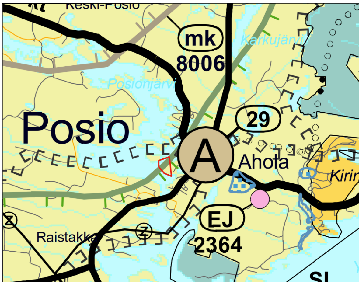
Kuva 2. Ote Itä-Lapin maakuntakaavasta. Kaava-alueen raja-alue on esitetty punaisella viivalla.