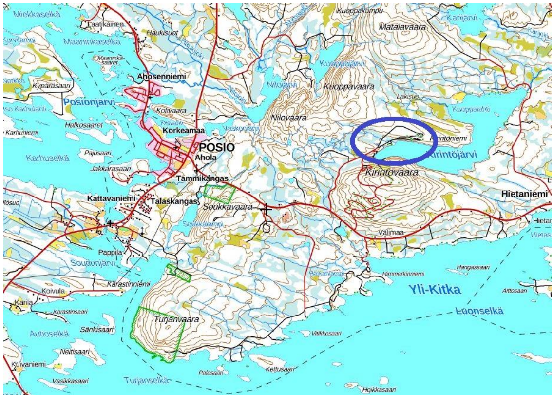
ALUEEN YLEISSIJAINTI. MUUTOSALUE SINISEN YMPYRÄN SISÄLLÄ

Kaavoitustyön tarkoituksena on muuttaa ranta-asemakaavaa asemakaavaksi siten, että myös pysyvä asuminen on mahdollista. Samalla on kaavamääräykset tarkoitettu laittamaan ajan tasalle, tarkistamaan korttelien ja rakennuspaikkojen rajat sekä kiinteistörajat toisiaan vastaavaksi, lisäämään rakennusoikeutta ja tekemään muut tarpeelliset muutokset. Tällä hetkellä alueen korttelit ovat loma- ja matkailurakentamiseen tarkoitettuja (RA1, RA2, RM). Kaava-alue on n. 5 km Posion keskustajamasta itään. Muutosalueen eteläpuolella on vireillä Kirintövaaran asemakaavan muutos ja ranta-asemakaavan muutos asemakaavaksi. Alueen yleissijainti on oheisella kartalla.